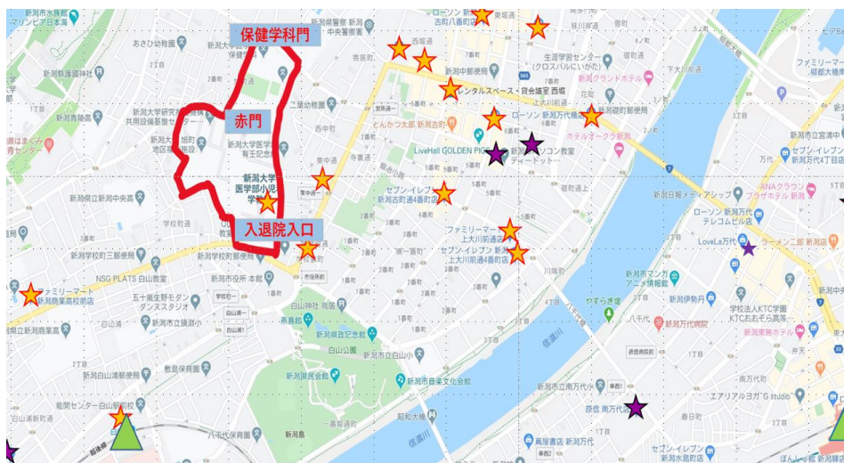
★スーパー★コンビニ▲駅(JR)